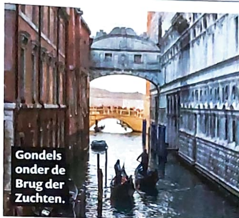
Gondels onder de Brug der Zuchten.

Het gebouw bestaat uit een tuin, een museum en een spiraaltrap, die je aan de bovenkant in de gelegenheid stelt om over de daken van de omliggende gebouwen te kijken. Hierdoor bekijk je Venetië vanuit een iets ander perspectief. Een aanrader! De toegang was slechts €7. Next stop was de Ponte di Rialto. Dit betreft de oudste én bekendste brug over het Canal Grande. Bovenop de brug en aan weerszijden is ruimte voor winkels, en er is genoeg gelegenheid om er de broodnodige souvenirs te kopen. De tweede dag besloten we van de