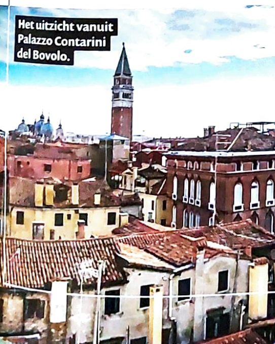
Het uitzicht vanuit Palazzo Contarini del Bovolo.

In Venetië zijn geen auto's, scooters of fietsen. Het komt erop neer dat je óf loopt óf vaart. Gelukkig is alles op het eiland goed te bewandelen. Vanaf het station tot aan de andere kant van het eiland loop je in ongeveer een uurtje. Doe goede schoenen aan en houdt rekening met de vele bruggen met trappen. Voor mensen die minder goed ter been zijn is er de watertaxi of de waterbus. De bus is een zeer betaalbare optie en die stelt je ook in de gelegenheid om het eiland af te gaan en naar het naburige Murano of het vasteland te gaan.